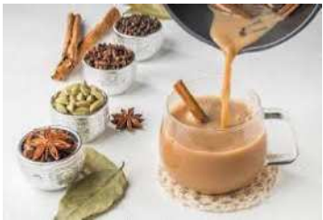
ちやい みらくていー チャイ (ミルクティ)

いざりす ばんぐらでいしゅなどに伝わり、 かくちいさまさま ばりえーしょんがあります。