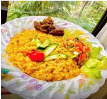
きちゅり まめ キチュリ (豆ごはん)